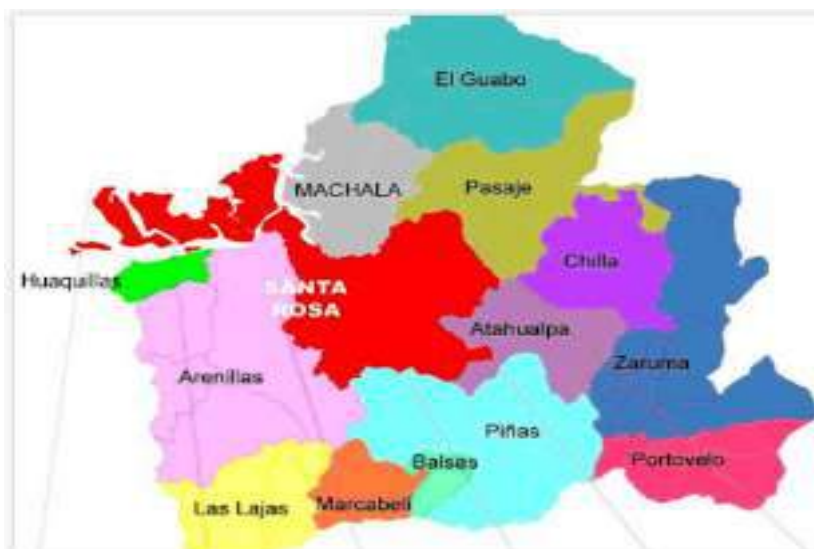
Gráfico 1.- Mapa de la Provincia de El Oro

La Provincia de El Oro es una de las 24 provincias que conforman la República del Ecuador, situada en el sur del país, en la zona geográfica conocida como región litoral o costa. Su capital administrativa es la ciudad de Machala, la cual además es su urbe más grande y poblada; ocupa un territorio de unos 5.988 km 2 , siendo la duodécima provincia del país por extensión. Sus límites son: al norte con Guayas, al sur y este con Loja, por el noreste con Azuay, y al occidente con el Departamento de Tumbes, Perú. En el territorio oreense habitan 715.751 personas proyectado al año 2020, según el último censo nacional (2010), siendo la sexta provincia más poblada del país. La Provincia de El Oro está constituida por 14 cantones, de las cuales se derivan sus respectivas parroquias urbanas y rurales.