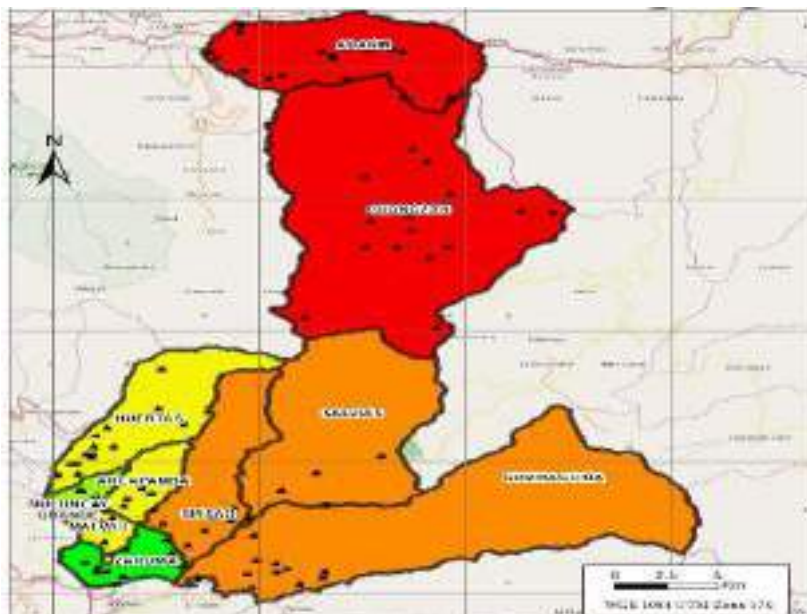
Gráfico 2.- Mapa del Cantón Zaruma

La población económicamente activa, proyectada al 2018 es de 11.537 personas; de ésta 5.449 (47,23%) están ubicados en el área urbana y 6.088 (52,77%) en el área rural. Las actividades de mayor relevancia que concentran el 60,15% de la PEA son: Explotación de minas y canteras el 31,13%, Agricultura, ganadería, silvicultura y pesca el 18,12% y Comercio al por mayor y menor el 10,90%. 1